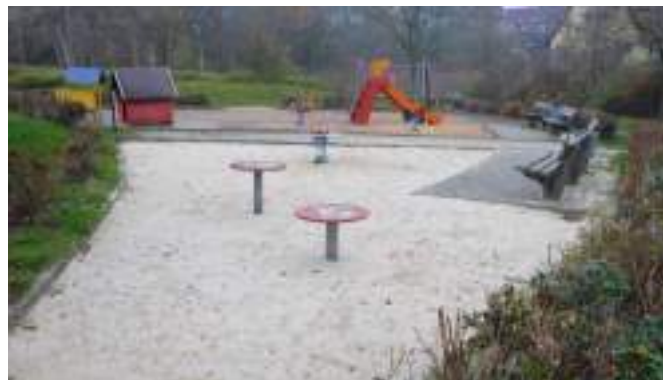
Der im Neubaugebiet Nord geplante Spielplatz hätte in etwa die Größe wie der am Lindenplan – zu wenig für einen ganzen Stadtteil.

in Frage. Aufgrund dieser ungeheuerlichen Vorkommnisse solle die Bauleitplanung kurzfristig nicht weiterverfolgt, sondern sowohl die Konsequenzen der unrechtmäßigen Waldumwandlung als auch der Diskreditierung des Rates diskutiert werden.