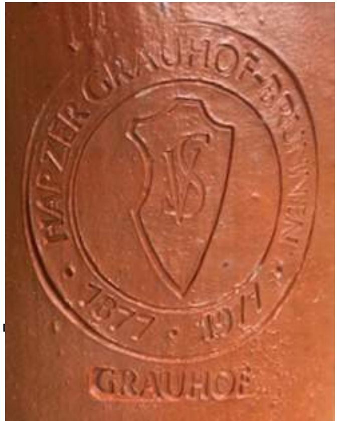
Tonflasche mit den Initialen von Völer und Saxer

Dieses sich anscheinend hoffnungsvoll entwickelnde neue Kurzentrum war für die Braunschweiger Eisenbahnverwaltung Anlass, den Bau einer bereits geplanten Eisenbahnlinie von Vienenburg nach Westen zu forcieren und noch im Jahre 1875 bis Grauhof fertigzustellen.