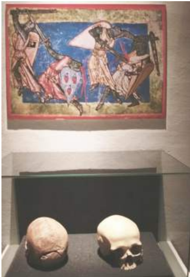
Zwei mittelalterliche Schädel mit Hiebverletzungen aus einer kriegerischen Verwicklung. Die Mittel der Fehde waren vielfältig und nicht immer nach wirtschaftlichen Schaden trachtend. Leihgeber: Dr. Christian Meyer (Rammelsbergraum)

Zudem wird an Hand der überlieferten, dokumentierten Fälle mittelbar deutlich, dass die Bedrohung zumeist keineswegs mehrheitlich von benachbarten Grafen, Herren und Rittern, sondern von der Stadt selbst ausging. Viele Briefe enthalten sogenannte Fehdeanzeigen der Stadt, welche von der hohen Konfliktbereitschaft der Ratsherren im Zentrum der Anordnung schmücken Topfhelm, Spieße, taktische Karten und Schautafeln die Szenerie aus.