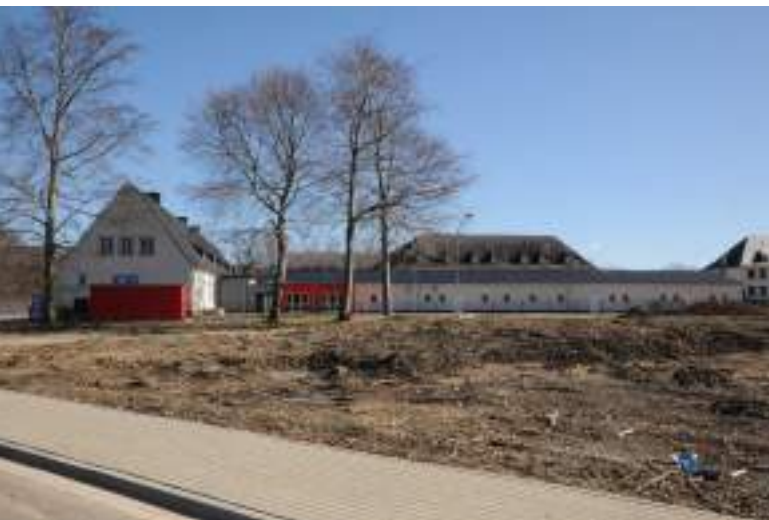
Die wenig anheimelnde Rückseite der KITA

Das Ergebnis ist im neuen Stadtteil allenthalben sichtbar: von den im Gutachten vorgeschlagenen Fußwegeverbindungen ist kaum etwas verwirklicht. Wie zu Bundeswehrzeiten ist das Gelände noch weitestgehend eingezäunt. Das Ostviertel kann weder von den neuen Bewohnern noch von Spaziergängern Grauhöfer Holz und Klosterkirche Grauhof durchquert werden. Man könnte von Goslars erster „gated community“ sprechen, einer Abschottung, die gesellschaftspolitisch nicht unproblematisch ist. Bebauungsdichte und Flächenversiegelung lassen vielfach wenig Platz für Gartenflächen; Spaziergänger, die den im Süden angrenzenden Wanderweg nutzen, werden durch Planen am Zaun optisch ferngehalten.