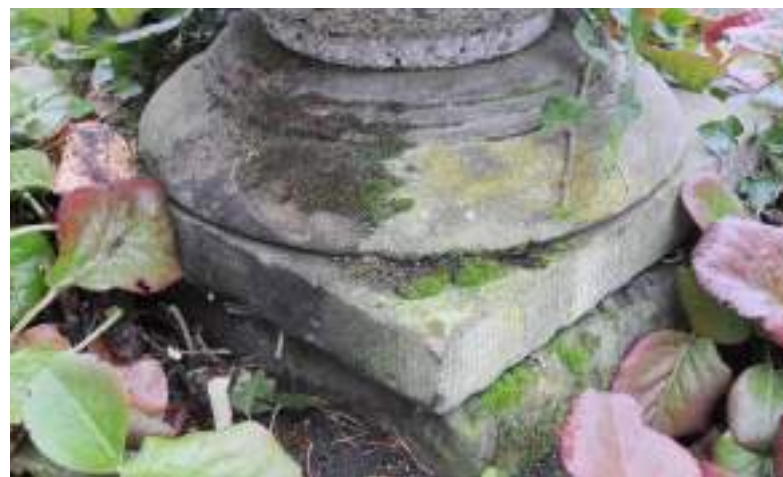
Säulenbasis mit Plinthe in einem Goslarer Garten