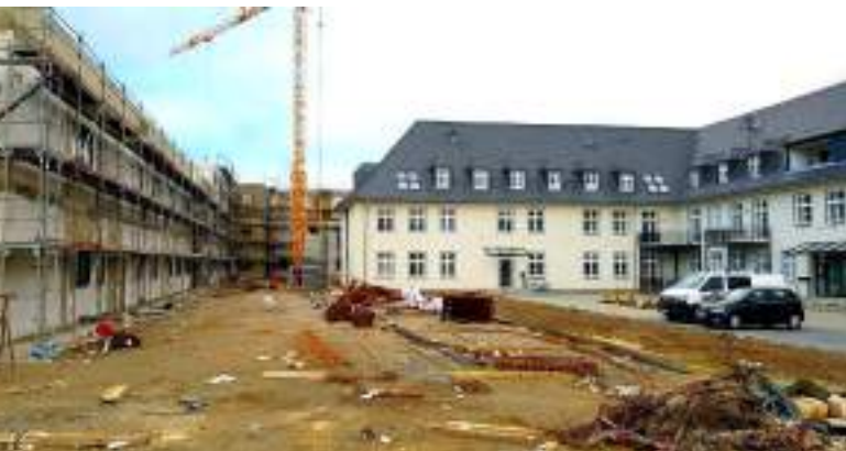
Das neue Ärztehaus verschattet die Sicht aus den Wohnungen des früheren Unterkunfts- und Mannschaftsgebäudes Nr. 58 auf den Harzrand und den Blick von der Straße im Fliegerhorst auf das denkmalgeschützte Gebäude Nr. 58 und den Zentralen Bereich

Eine Auseinandersetzung mit der aus der NS-Zeit stammenden Architektur hat nicht stattgefunden. Statt eine architektonische oder freiraumplanerische Antwort auf die Kasernenarchitektur zu suchen, ist die Neubebauung ausschließlich durch maximale Grundstücksverwertung gekennzeichnet. Unterschiedliche Bauformen, Gebäudehöhen und Dächer zeugen von kaum eingeschränkter Baufreiheit. Die Befürchtung, dass die fehlende Auseinandersetzung mit dem Bestand zukünftig zu dessen höherer Wertschätzung als die Neubebauung führt, ist nicht von der Hand zu weisen. Dies könnte eine ungewollte Aufwertung der dahinterstehenden NS-Ideologie nach sich ziehen.