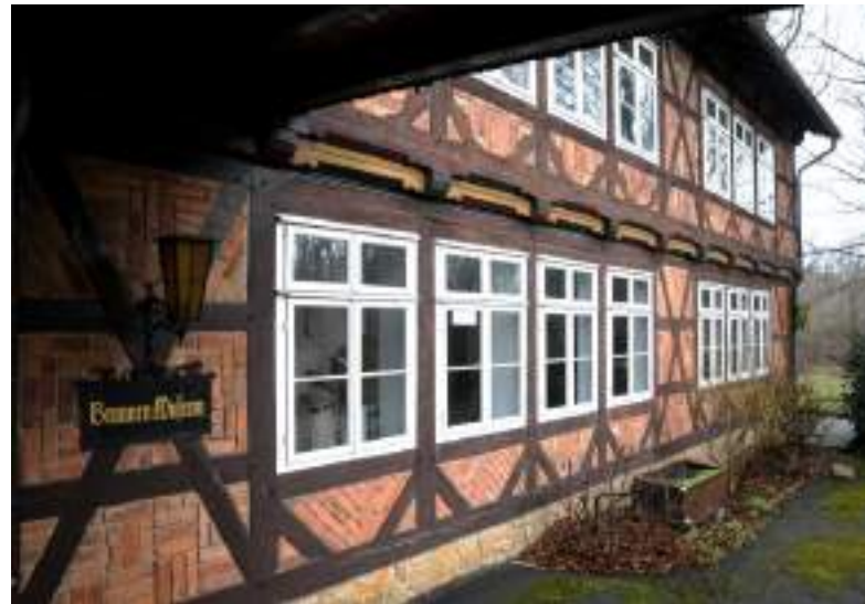
Brunnen-Museum im Haus Riechenberg, einem Baudenkmal

Nach dem Zweiten Weltkrieg wuchs aus der Notwendigkeit, die Abholer des Mineralwassers zu bewirten, die Gastronomie im Grauhöfer Holz. Im Laufe der Jahre wurde aus einer kleinen Kantine, westlich des aus Richtung Fliegerhorst kommenden Weges „Am Grauhof Brunnen“, die Quellschänke und später das Blaue Quellen Haus. Dem damaligen Brunnen-