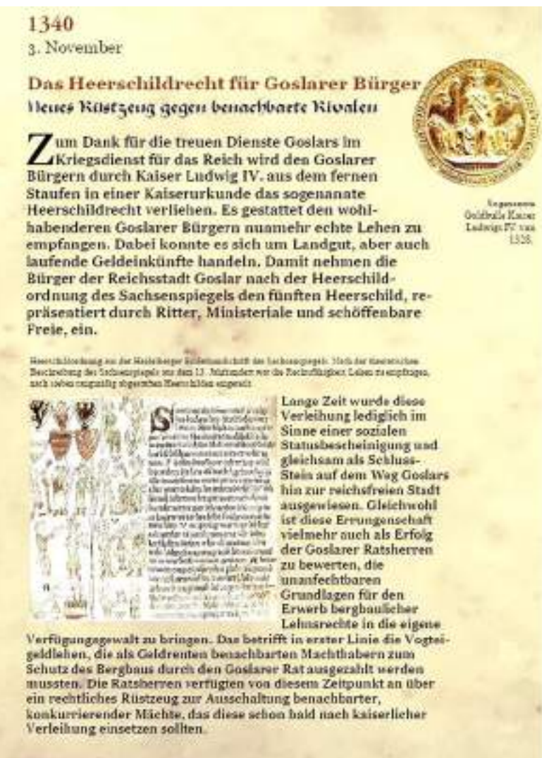
Schautafel im „Zeitstrahl“ des Gilderaums

Die wachsende militärische Schlagkraft, die Ausdifferenzierung der städtischen Wehrorganisation mit den im 14. Jahrhundert erstmals nachweisbaren Stadthauptleuten, Armbrustschützen und Büchsenmachern, ist auch als Begleiterscheinung der inneren, verfassungsmäßigen Verhältnisse Goslars auf der Führungsebene zu betrachten. Denn wichtigste Institution an der Stadtspitze bleibt der Rat, dessen Mitglieder aus einem festgelegten Kreis ratsbürtiger Goslarer Gilden bestellt bzw. gewählt werden: die Kaufleute, die Krämer, die Münzer, die Bäcker, die Schuhmacher, die Stahlschmiede und die Kürschner. Trotz mehrfacher Wandel in der Anzahl des aller drei Jahre rotierenden sitzenden Rats haben sich die Gildezugehörigkeiten als exklusive Zugangsvoraussetzungen in Goslar noch bis weit in das beginnende 15. Jahrhundert hinein erhalten, als in anderen Reichsstädten wie Augsburg (1368), Straßburg (1332) oder Nürnberg (1348) die Erhebung der Zünfte das von Patriziern aristokratisch geführte Stadregiment schon längst in Frage gestellt und Verfassungswandel gefordert hatten.