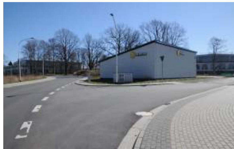
Mercur begrüßt am Westeingang

Öffentliche Grünflächen fehlen in dem neuen Stadtteil, der die Hälfte der Altstadtgröße erreicht, vollständig. Baumanpflanzungen entlang der Straßen: Fehlanzeige. Lärmschutzwall und Regenrückhaltebecken wurden nicht in zugängliche Grünflächen einbezogen, sondern weitgehend durch Zäune ausgegrenzt. Der neue Stadtteil setzt auf das Auto: Fußgänger, Radfahrer und Kinder haben das Nachsehen.