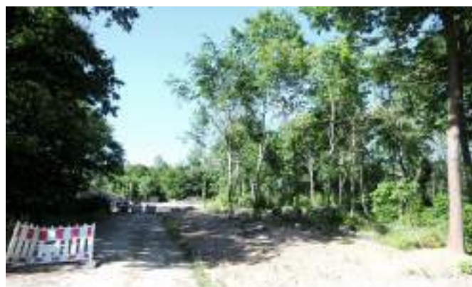
Ungenehmigt abgeholzter Baumbestand im Bereich des Bebauungsplans 177 am 01.06.2020