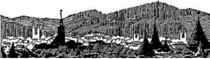
Goslar im Dezember 2020

Sehr geehrte Freundinnen und Freunde des Geschichtsvereins Goslar, liebe Mitglieder,