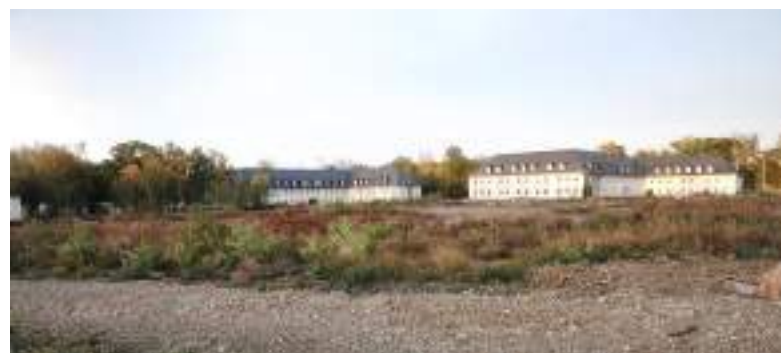
Der gleiche Blick am 21.9.2018

Die Vorschläge des städtebaulichen Gutachtens zur baulichen Ergänzung des vorhandenen Baubestandes wurden zugunsten einer weitgehenden Baufreiheit aufgegeben. Die Stadt Goslar ließ den Investoren nahezu freie Hand. Und nicht nur das: Sie vermied es, Forderungen zum Gemeinwohl hinsichtlich Grünflächen, Spielplätzen, Fußwegeverbindungen, Radwegen und Besucherstellplätzen zu stellen. Als Folge davon gibt es keine öffentlichen Bereiche mit Aufenthaltsqualität.