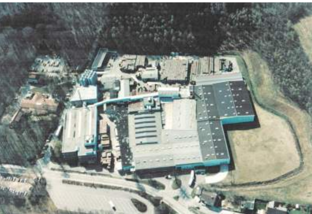
Luftbild des Harzer Grauhof Brunnens 1997, links Haus Riechenberg mit dem Brunnen-Museum.

Mit „Grauhof“ bezeichnete man schon in früherer Zeit das Kloster und die weitläufige Gemarkung um das Kloster herum und so hat dieser Mineralbrunnen den Namen „Harzer Grauhof Brunnen“ bekommen.