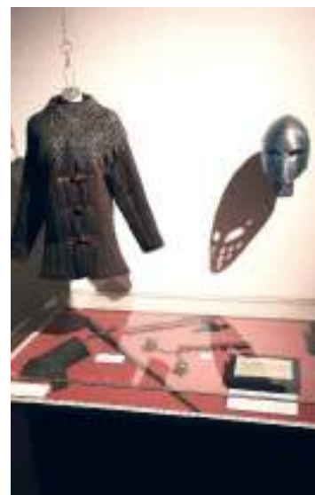
Ausstellungsplattform mit Rüstungsteilen, Waffen und den „Goslarer Briefen“ (Ende 14. Jahrhunderts) (Rammelsbergraum)

Es kam zu Klagen und Drohungen der Betroffenen und mithin zu Fehden, die zumeist von den militärisch mächtigeren Stadtherren dominiert werden konnten. Am Ende dieser städtischen Zermürbungstaktik stand von Fall zu Fall zumeist der Anspruchsverzicht durch den Adeligen bzw. die Auslösung dieser Vogteigeldbriefe im anschließenden Gerichtsverfahren und damit der schrittweise Erfolg der Reichsstadt auf dem Weg zur Behauptung und Unabhängigkeit.