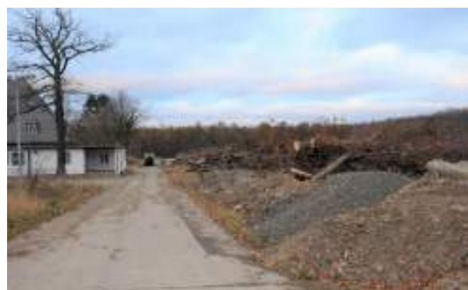
Die gleiche Perspektive am 07.12.2020.