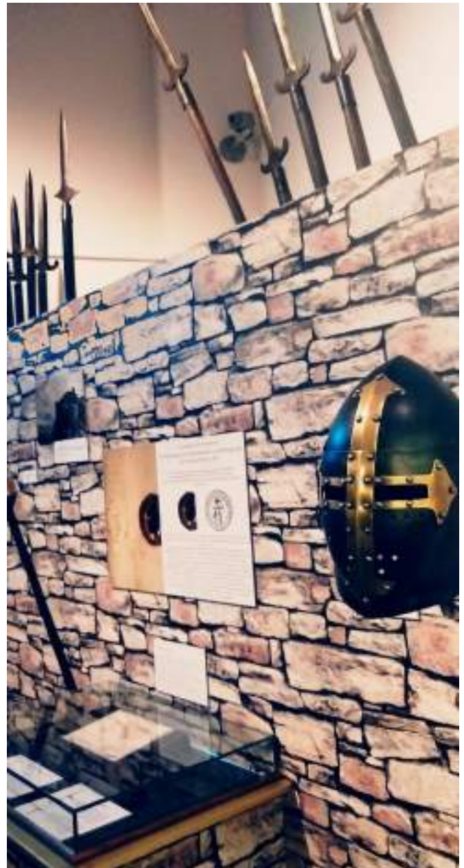
Ausstellungsplattform zur Grafenfehde von 1379 (Rammelsbergraum)

Zur Beseitigung dieser einseitigen Lasten begannen die Ratsherren ab den 1370er Jahren, den Adeligen zunehmend die Zinsauszahlungen vorzuenthalten.