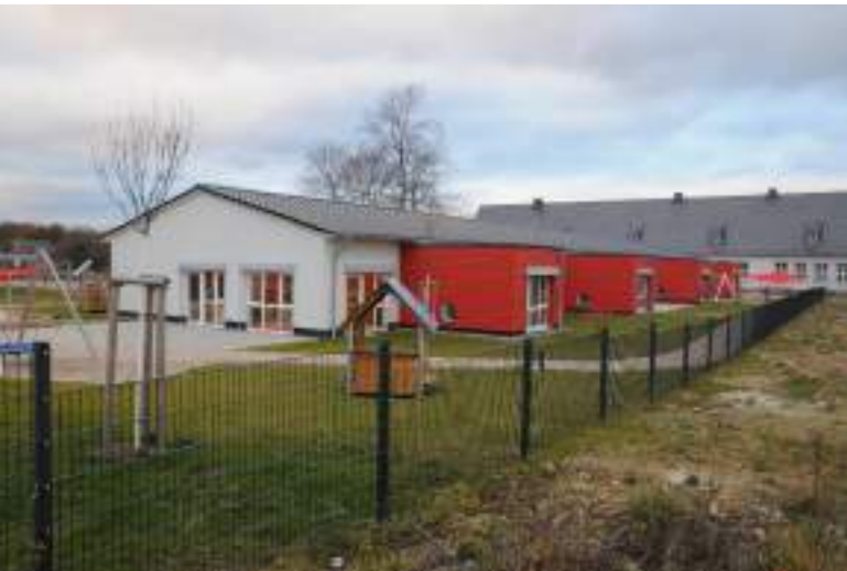
Kindertagesstätte mit Außenanlagen