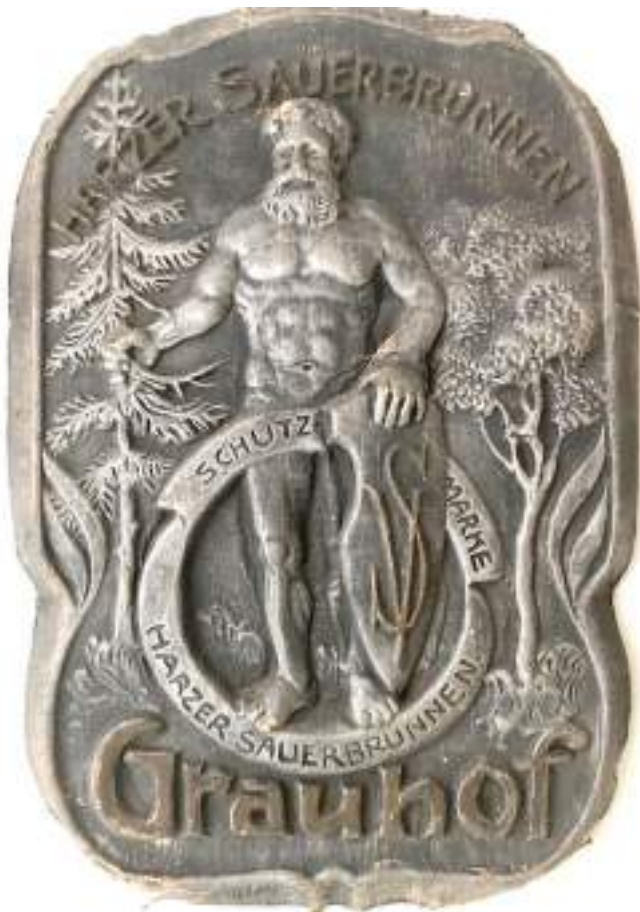
Wilder Mann

Trotz immer wieder hinzunehmenden Rückschlägen infolge wirtschaftlicher Rezessionen entwickelte sich der Brunnenbetrieb stetig aufwärts. Starke Zäsuren brachten das Ende des Ersten, insbesondere aber das Ende des Zweiten Weltkrieges mit sich. Der „Harzer Sauerbrunnen Grauhof“ wurde von Mai 1945 bis Anfang 1948 unter britische Zwangsverwaltung gestellt, die wiederum für die Versorgung der Besatzungstruppen produzieren ließ. Auch die Teilung Deutschlands bewirkte, das annähernd 70% der Kunden des Grauhof-Brunnens verloren gingen. In zielstrebigem Arbeit erschloss sich der Harzer Grauhof-Brunnen Niedersachsen und Bremen als neues Absatzgebiet. West-Berlin blieb weiterhin eine Grauhof-Domäne.