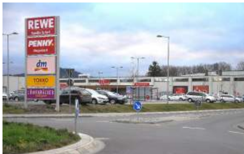
Die Versorgung Jürgenohls und des neuen Stadtteils übernimmt das Einkaufszentrum. Autogerecht geplant ist es zu Fuß nur über Fahrbahnen und Böschungen zu erreichen.

Die Vorschläge des städtebaulichen Gutachtens zur baulichen Ergänzung des vorhandenen Baubestandes wurden zugunsten einer weitgehenden Baufreiheit aufgegeben. Die Stadt Goslar ließ den Investoren nahezu freie Hand. Und nicht nur das: Sie vermied es, Forderungen zum Gemeinwohl hinsichtlich Grünflächen, Spielplätzen, Fußwegeverbindungen, Radwegen und Besucherstellplätzen zu stellen. Als Folge davon gibt es keine öffentlichen Bereiche mit Aufenthaltsqualität.