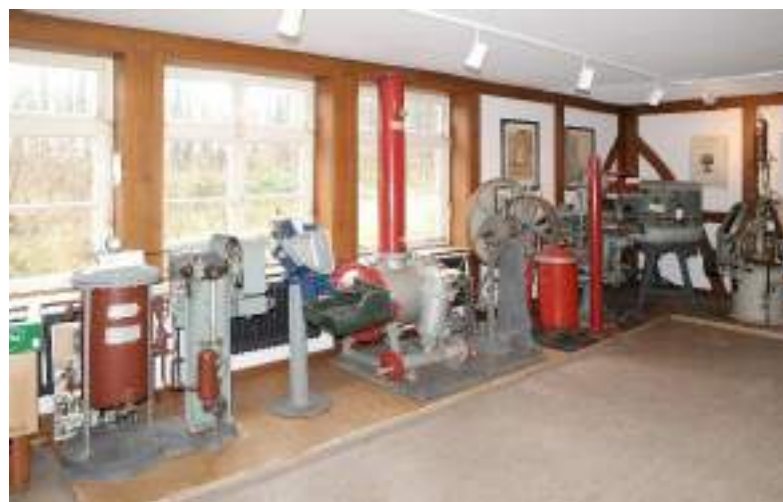
Produktionsmaschinen im Brunnen-Museum

liegendes Gut zurück. Sie begannen ein neues Kloster zu bauen, das mit Einweihung der weitberühmten Klosterkirche, der schönsten Barockkirche Norddeutschlands, 1711 fertig gestellt wurde.