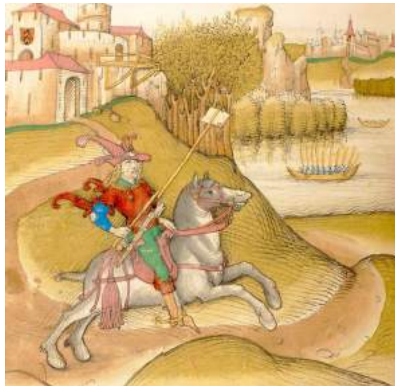
Fehde-Ansage eines Grafen an eine spätmittelalterliche Stadt aus der Spiezer Chronik (1484/85), Burgerbibliothek Bern – das zeitgenössische Leitmotiv der Sonderausstellung (Abbildungen von Dr. Habermann)

Das Vorhaben, ausgerechnet Goslars Spätmittelalter als Thema einer Sonderausstellung zu wählen, findet eine Begründung in der allgemeinen Wahrnehmung der Epoche. Vielfach gilt das späte Mittelalter, die Zeit zwischen 1250 und 1500, als eine Ära der Wirrnisse und Krisen; im Verfall der kaiserlichen „Zentralgewalt“ und der Entstehung eigenständiger Territorien, insbesondere im Vordringen des Fehde- und Kriegswesens, sah man seit dem 19. Jahrhundert Zeichen eines Niedergangs: „der Herbst des Mittelalters“.