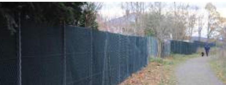
Sichtschutz durch verhängten Zaun im Ostviertel

Das Ergebnis ist im neuen Stadtteil allenthalben sichtbar: von den im Gutachten vorgeschlagenen Fußwegeverbindungen ist kaum etwas verwirklicht. Wie zu Bundeswehrzeiten ist das Gelände noch weitestgehend eingezäunt. Das Ostviertel kann weder von den neuen Bewohnern noch von Spaziergängern Grauhöfer Holz und Klosterkirche Grauhof durchquert werden. Man könnte von Goslars erster „gated community“ sprechen, einer Abschottung, die gesellschaftspolitisch nicht unproblematisch ist. Bebauungsdichte und Flächenversiegelung lassen vielfach wenig Platz für Gartenflächen; Spaziergänger, die den im Süden angrenzenden Wanderweg nutzen, werden durch Planen am Zaun optisch ferngehalten.