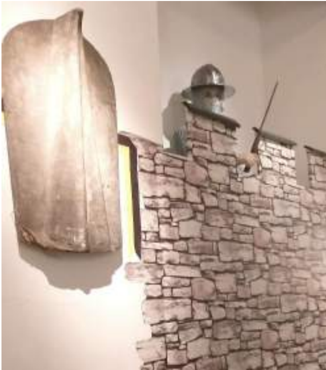
Pavese „Setzschild“ (l.) und Goslarer Mauerwache (r.) im 14. Jahrhundert (Gilderaum)

Blieb demnach in Goslar während des dramatischen 14. Jahrhunderts der aristokratische Charakter der Ratsverfassung gewahrt, so konnte dies für die strategische Ausrichtung, d. h. auch für die langfristige Verfolgung von